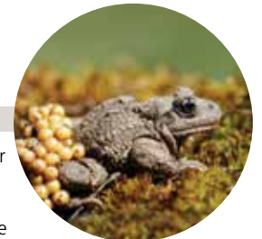
C. Cuenin / Parc national des Pyrénées

Taille : 4 à 5 cm Reproduction : mars à juillet