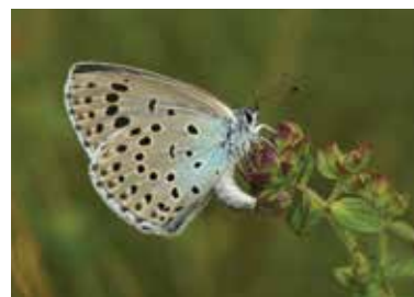
D. Demergès / CEN Midi-Pyrénées

< L'Azuré du Serpolet vit dans des prairies ou des pelouses chaudes et bien exposées. Sa chenille se développe au sein d'une fourmière, offrant un cas remarquable d'entre-aide animale.