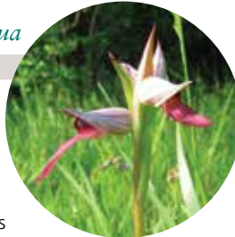
S. Déjean / CEN Midi-Pyrénées

Relativement fréquente à l'échelle du département, cette magnifique orchidée plutôt discrète traduit localement la présence d'un microclimat chaud et humide. À une échelle régionale voire au-delà, la raréfaction de l'habitat de cette espèce représente une menace pour sa conservation. Sur la commune, l'espèce n'est pas menacée et les pratiques en cours sont favorables à son maintien.