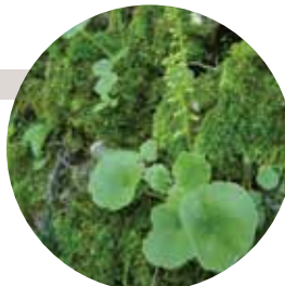
F. Laigneau / CBNPMP

Vivace, il se développe sur les vieux murs ombragés et peut mesurer jusqu'à 40 cm de haut. Du printemps à l'été, le randonneur pourra observer les délicates inflorescences portant de multiples fleurs blanches teintées de vert. Ses feuilles sont comestibles fraîches et auraient des propriétés cicatrisantes reconnues.