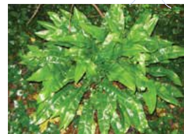
S. Déjean / CEN Midi-Pyrénées

8 La Scolopendre est reconnaissable à ses grandes frondes planes, vertes et luisantes. Elle se développe dans les sous-bois, parfois sur les vieux murs ombragés ou dans les puits, à même le sol en touffes plus ou moins denses.