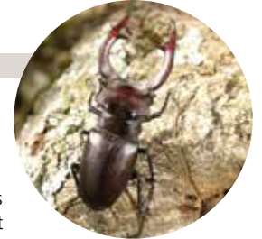
N. Gouix / CEN Midi-Pyrénées

Taille : jusqu'à 80 mm Observation : mai à juillet