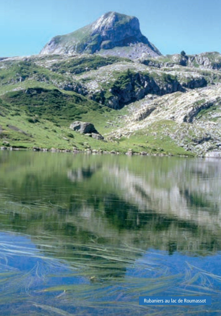
Rubaniers au lac de Roumassot