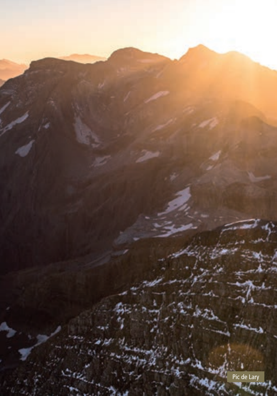
Pic de Lary