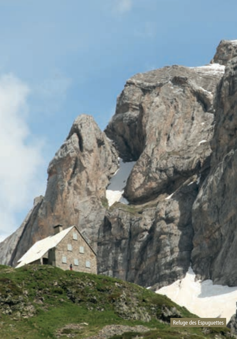
Refuge des Espuguettes