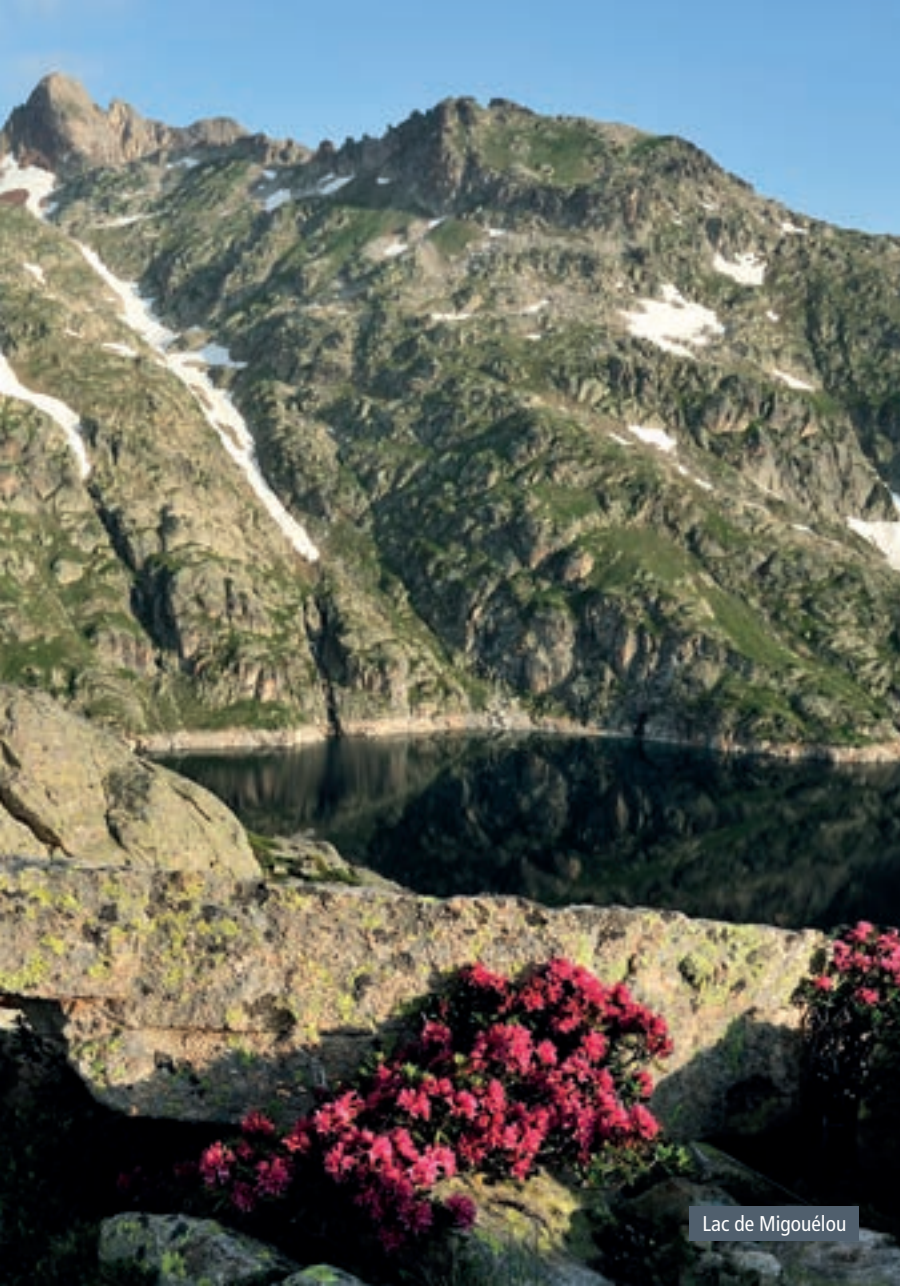
Lac de Migouélou