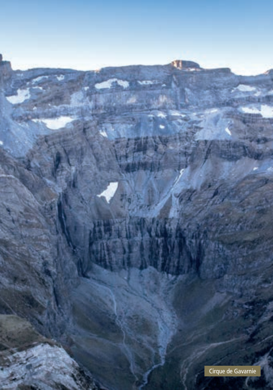
Cirque de Gavarnie