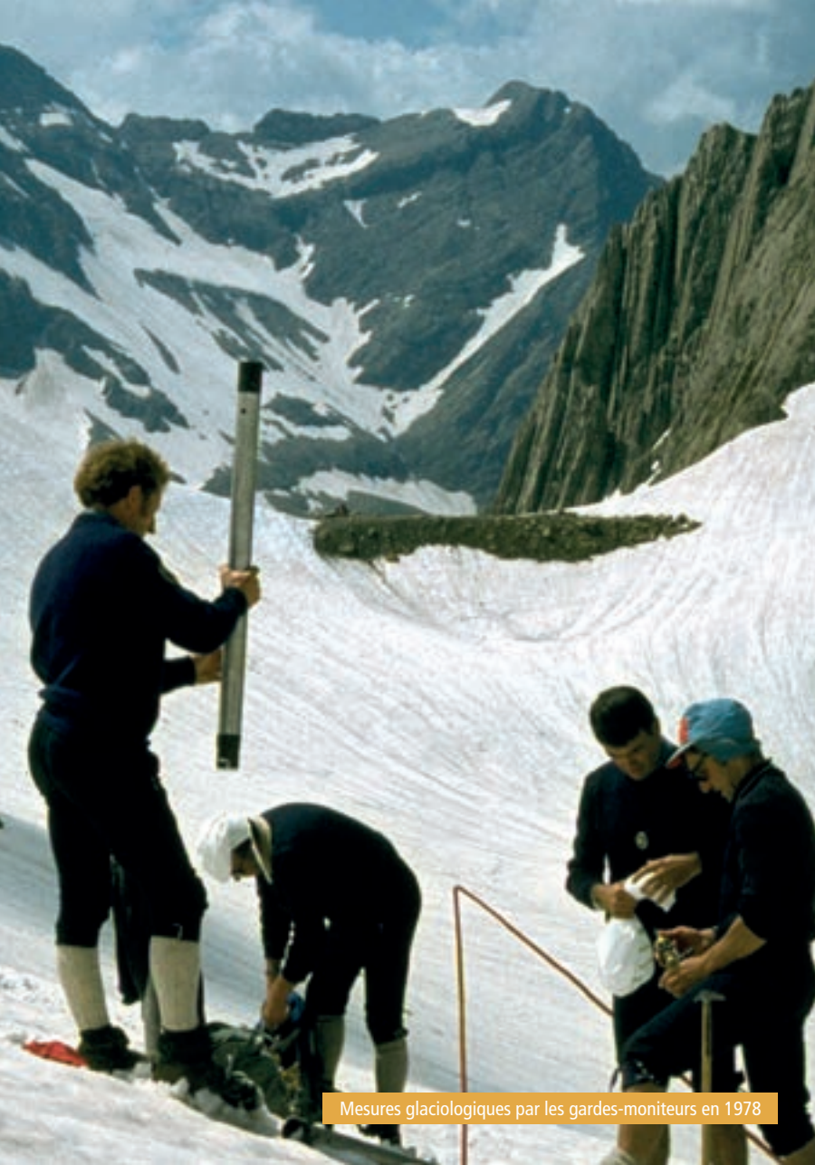
Mesures glaciologiques par les gardes-moniteurs en 1978