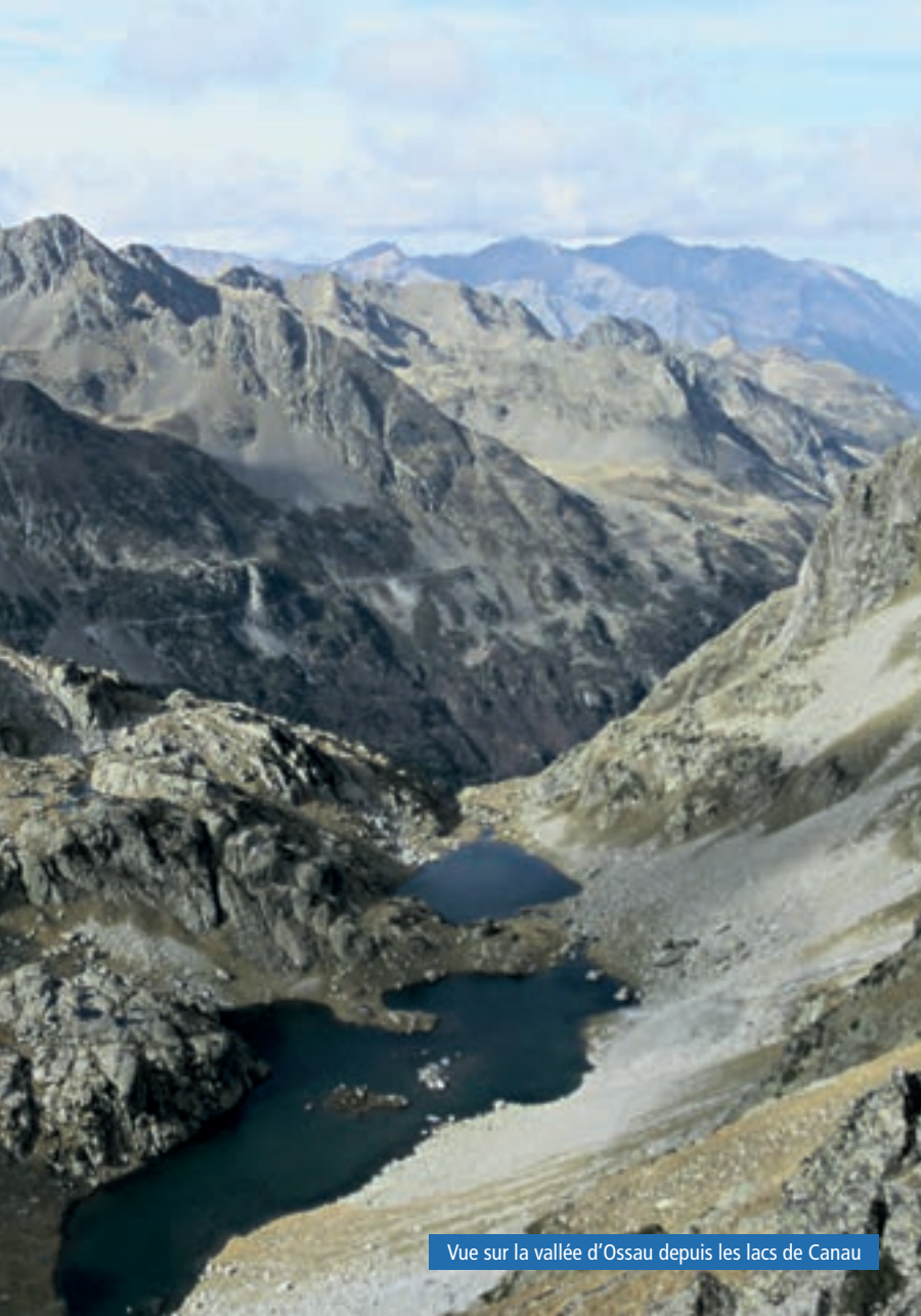
Vue sur la vallée d'Ossau depuis les lacs de Canau