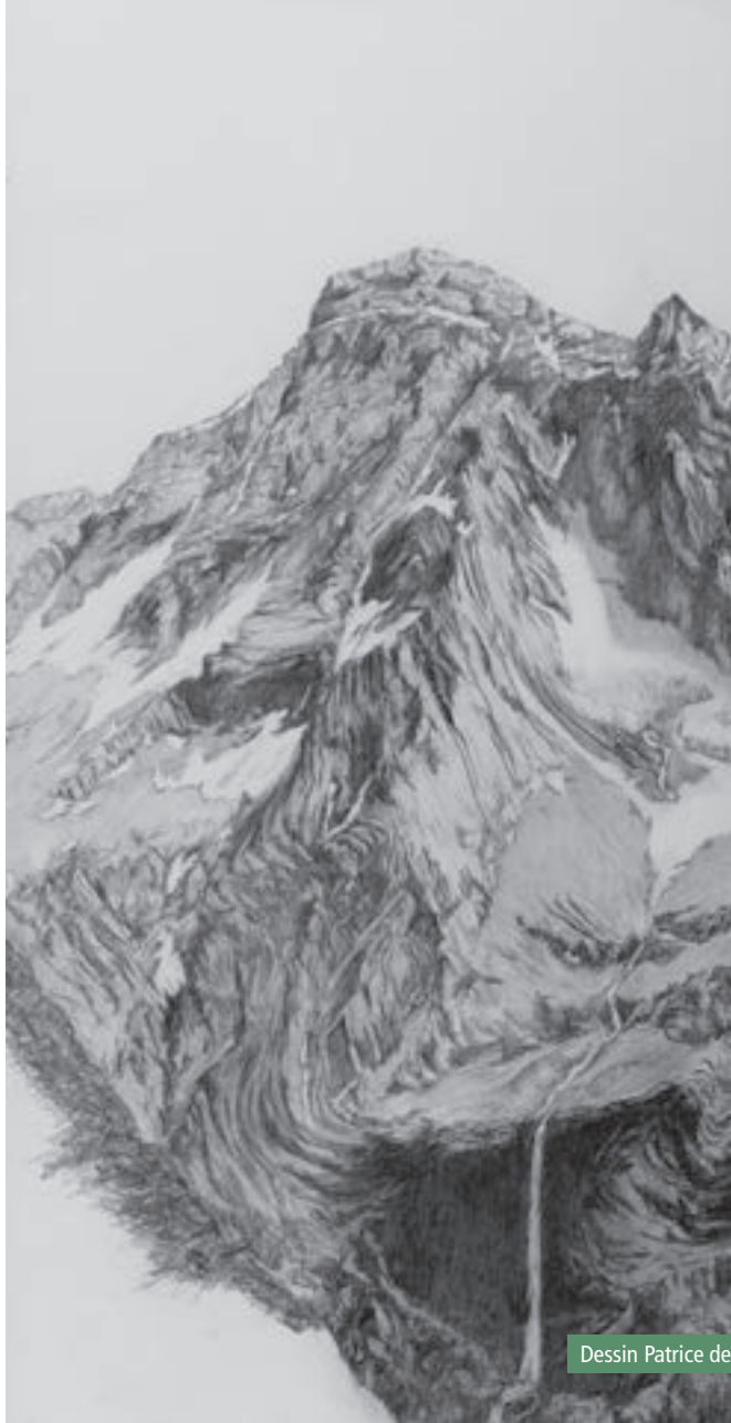
Dessin Patrice de Bellefon