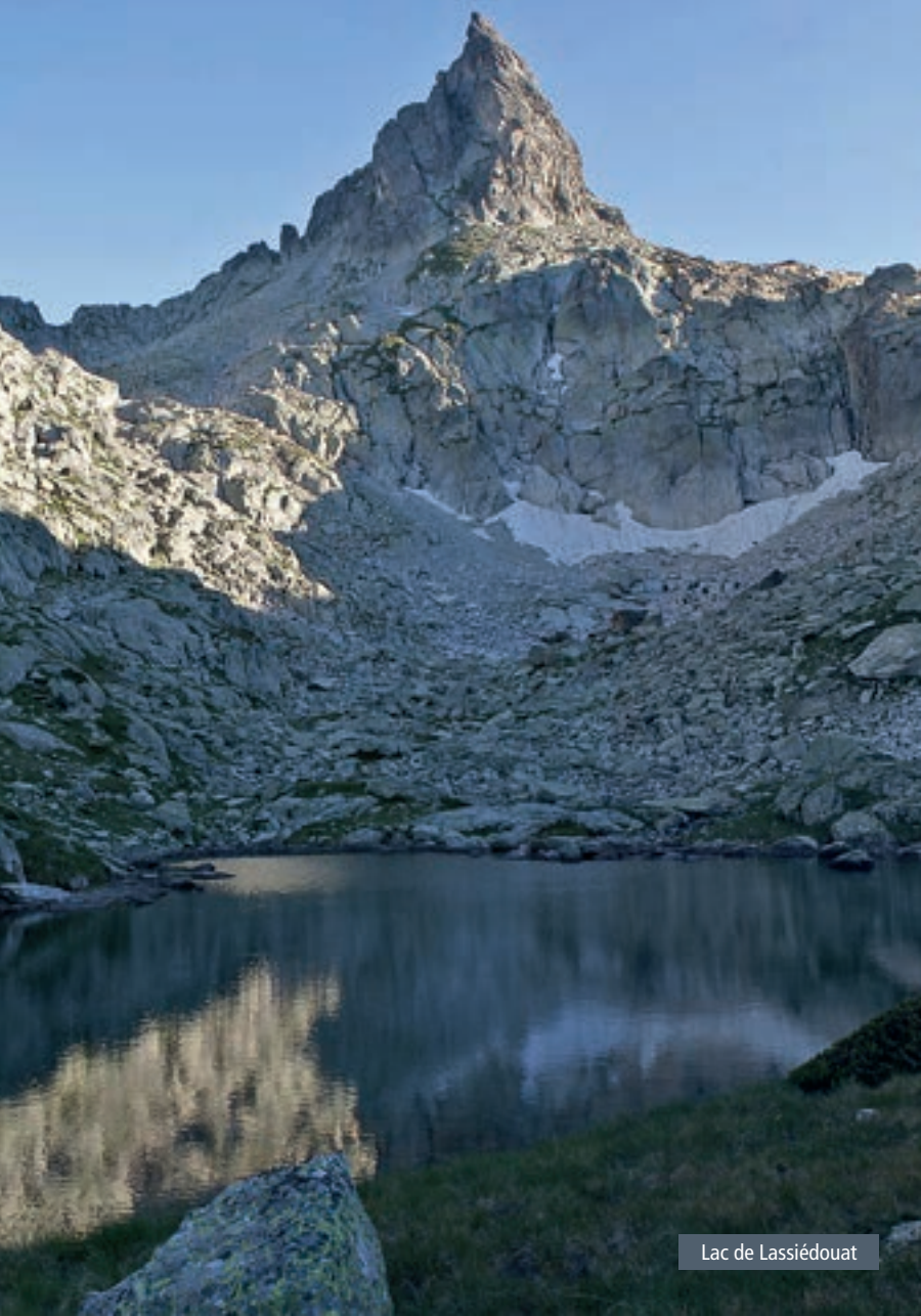
Lac de Lassiédouat