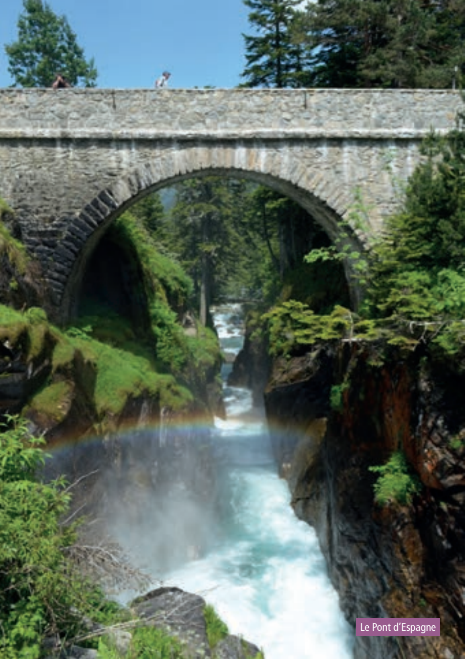
Le Pont d'Espagne