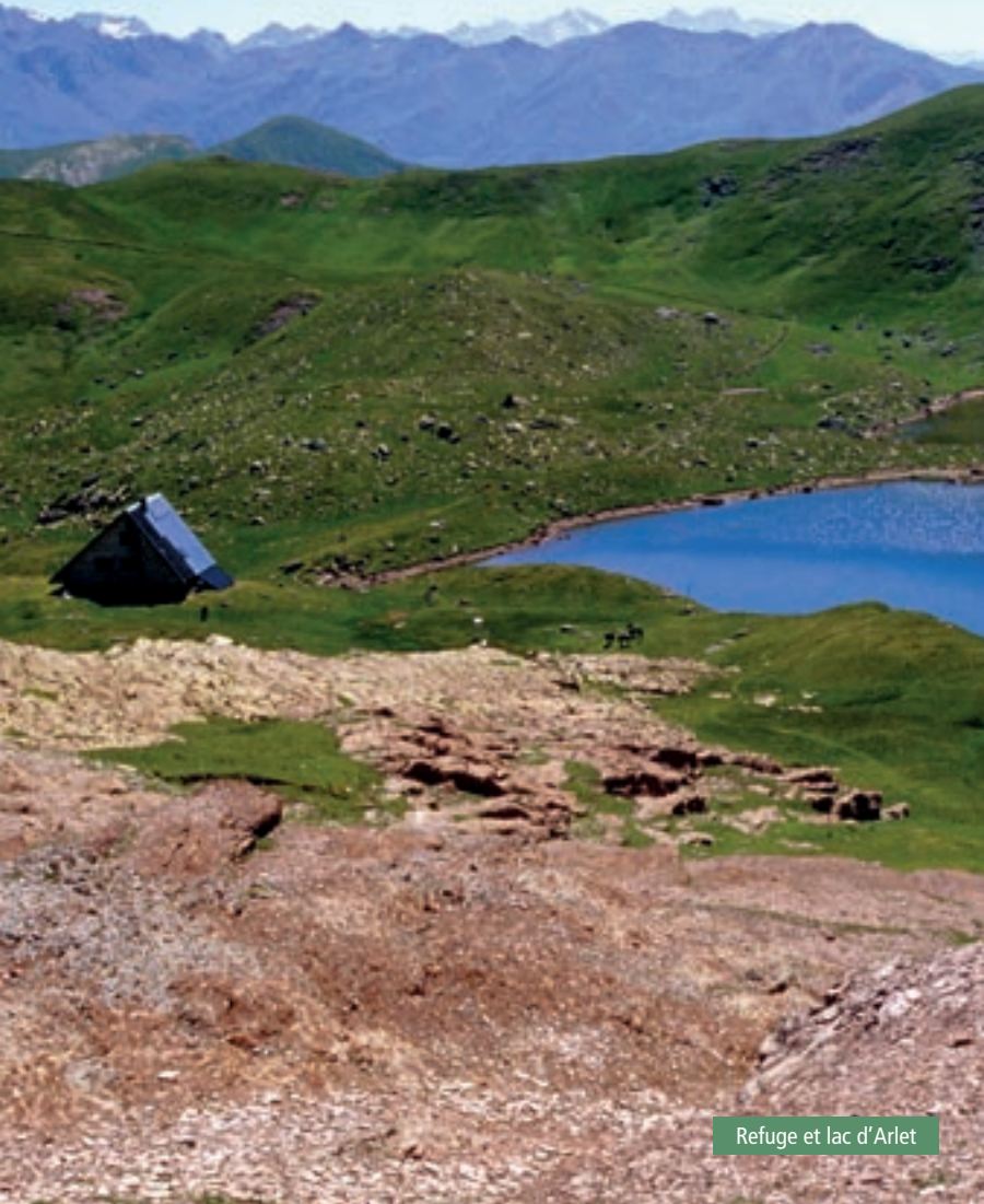
Refuge et lac d'Arlet