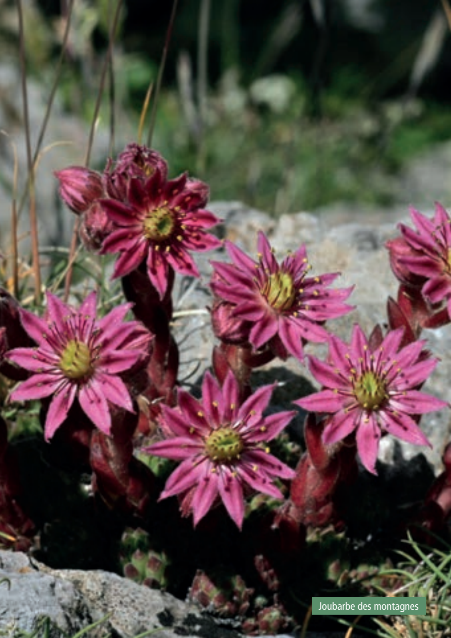
Joubarbe des montagnes