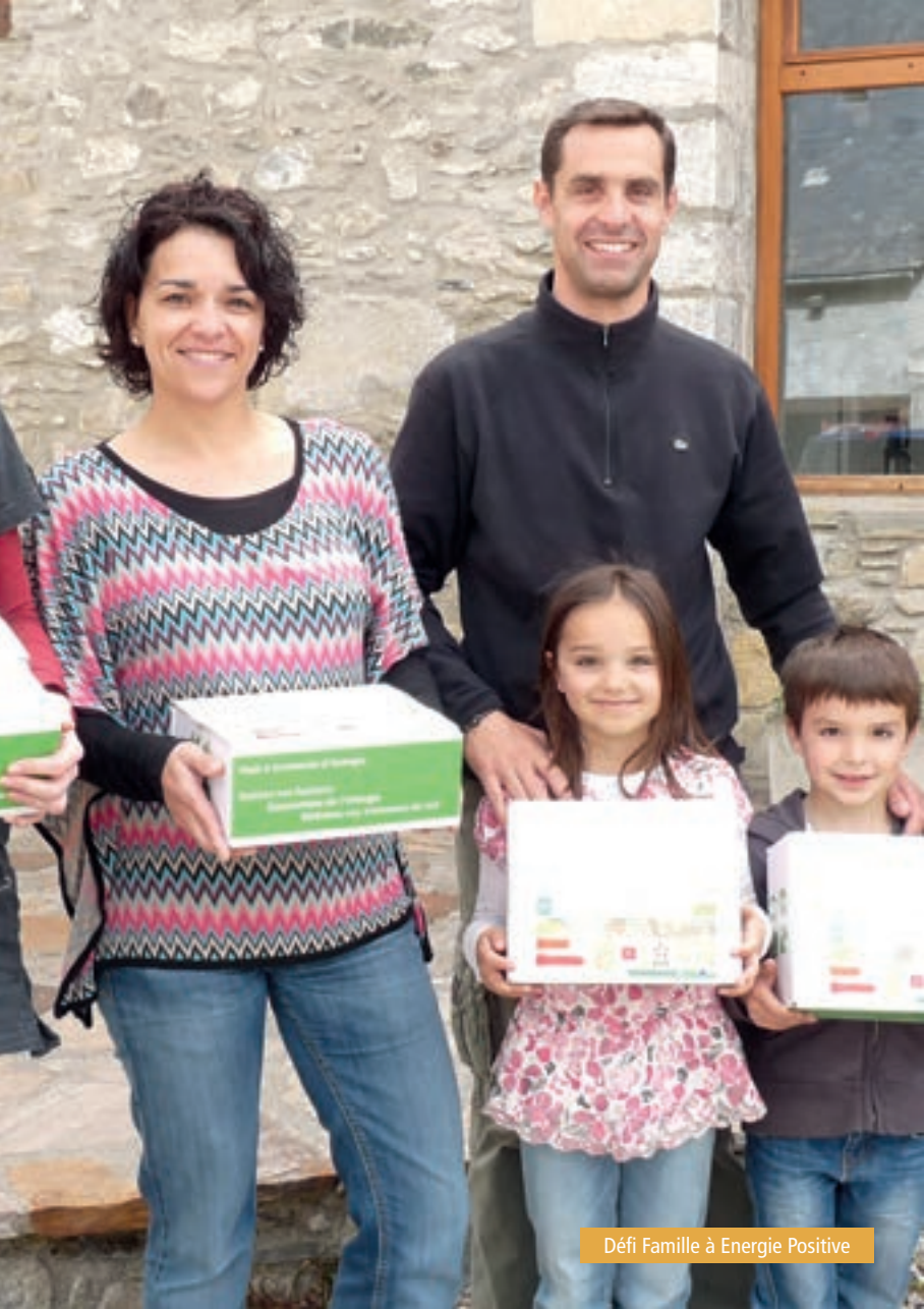
Défi Famille à Energie Positive