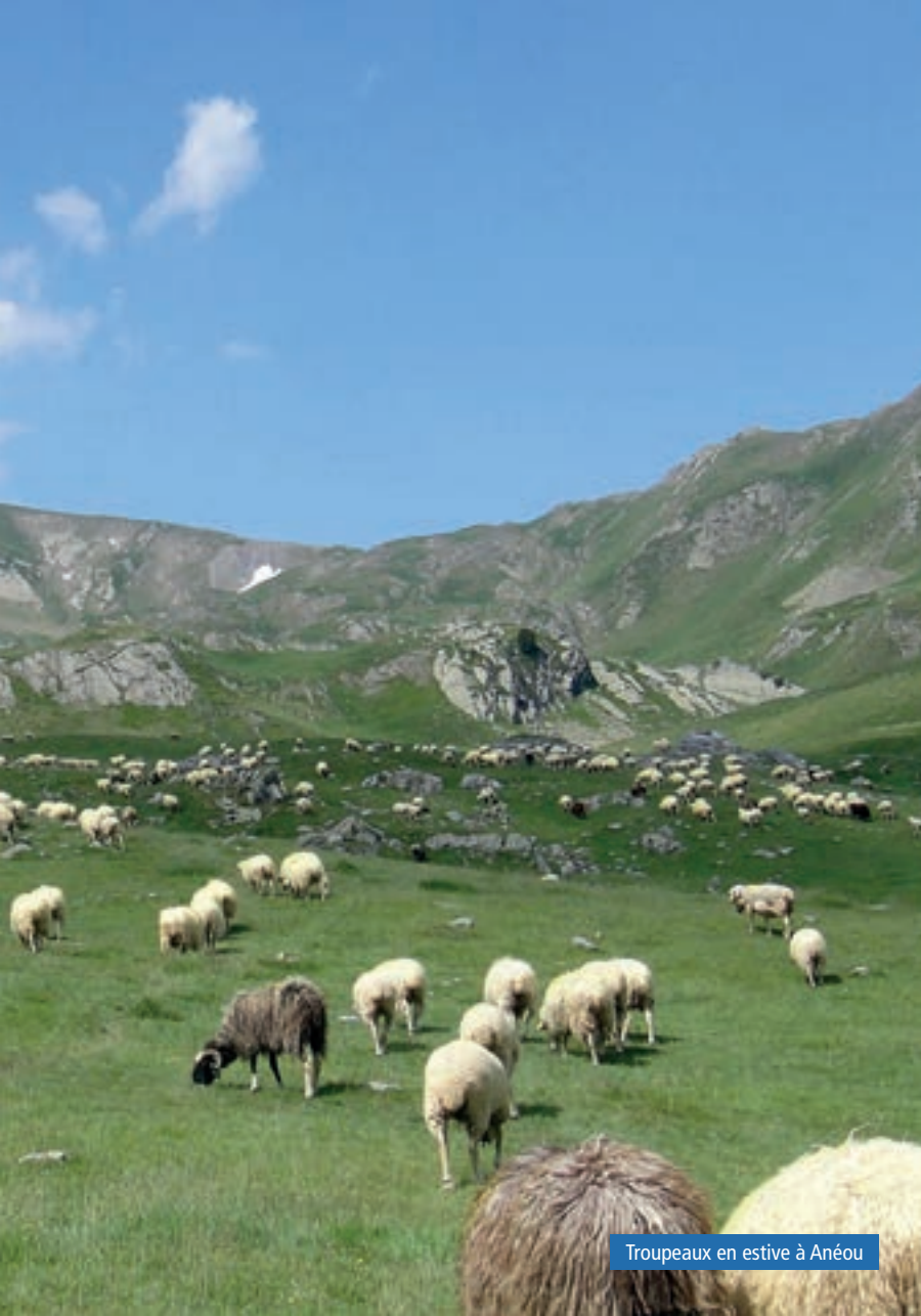
Troupeaux en estive à Anéou