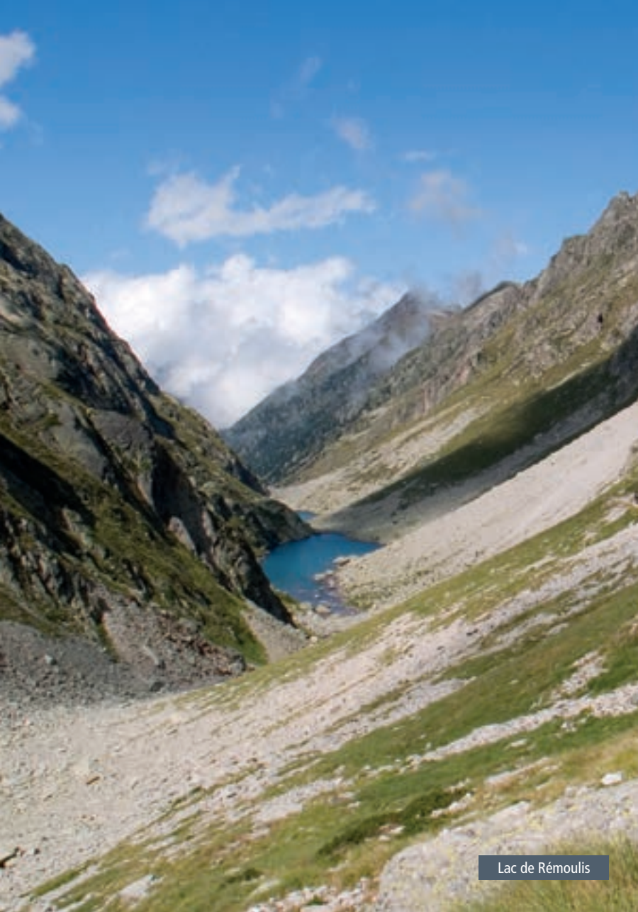
Lac de Rémoulis