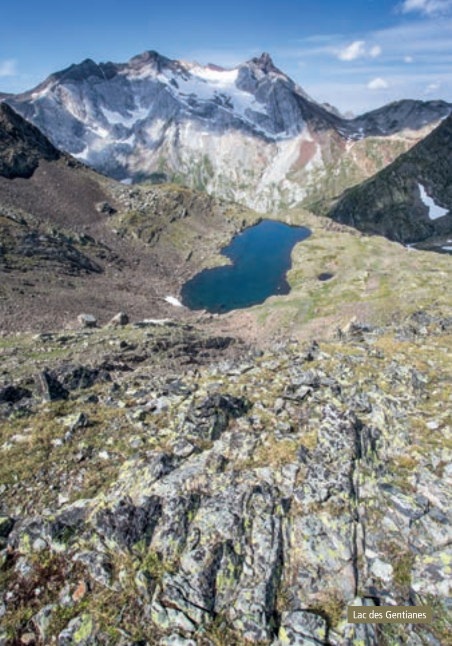
Lac des Gentiannes