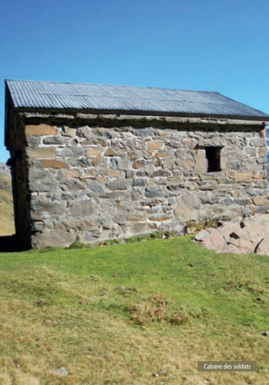
Cabane des soldats