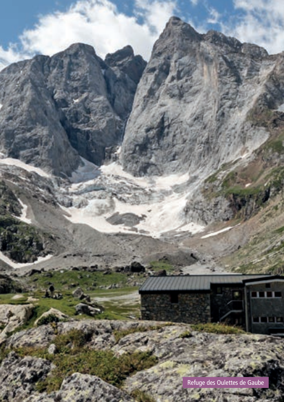
Refuge des Oulettes de Gaube