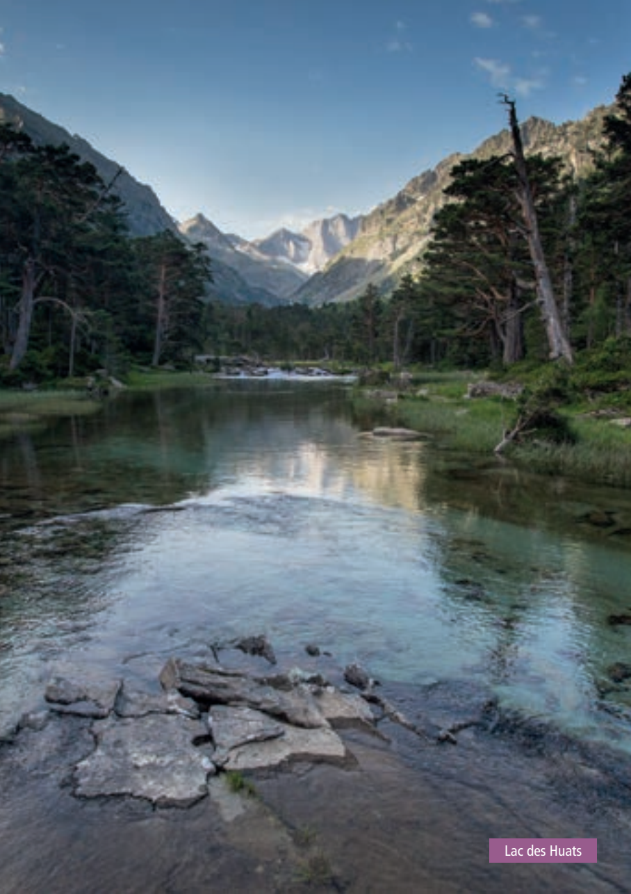
Lac des Huats