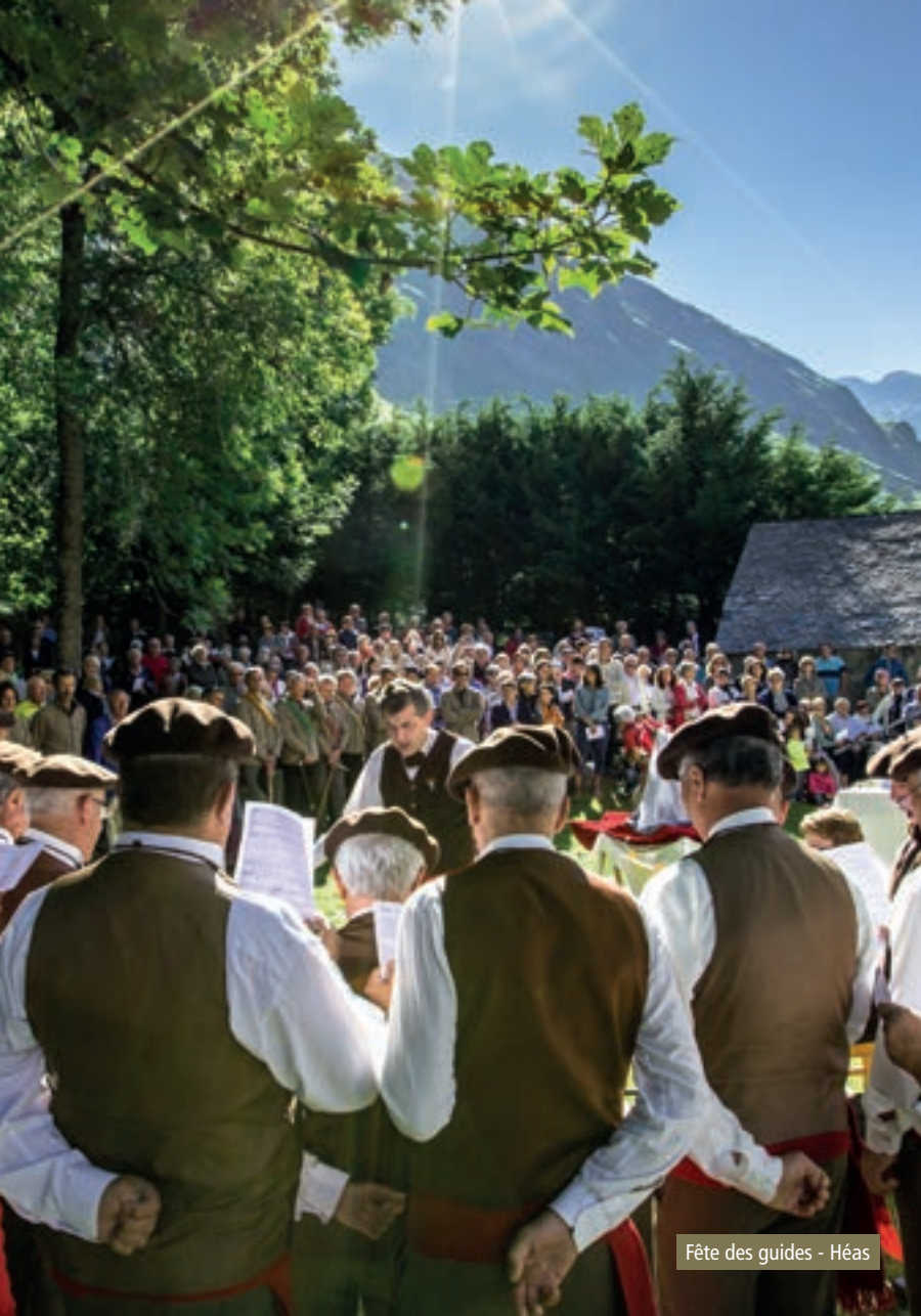
Fête des guides - Héas