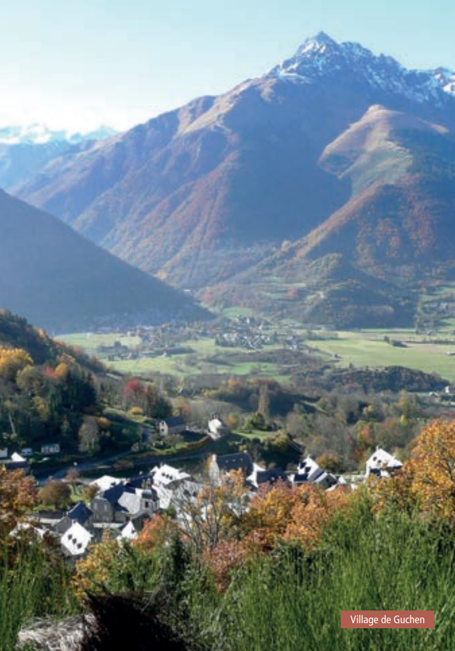
Village de Guchen