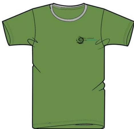
Logo coeur base 8 cm Noir et vert pantone 7475 C