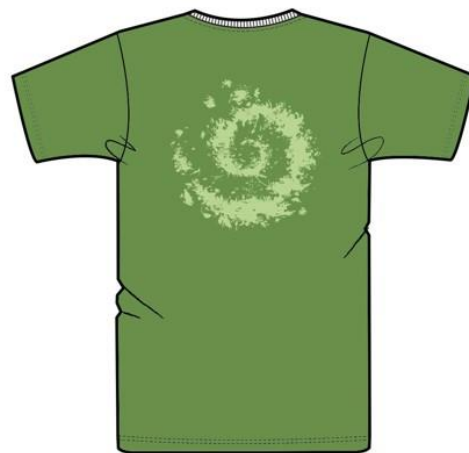
Logo dos base 25 cm pantone 7486 C

Nombre d'exemplaires total : 350 exemplaires 100 exemplaires – taille S 100 exemplaires – taille M 100 exemplaires – taille L 50 exemplaires taille XL