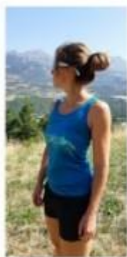
DÉBARDEUR MASSIF DES ECRINS FEMME TURQUOISE