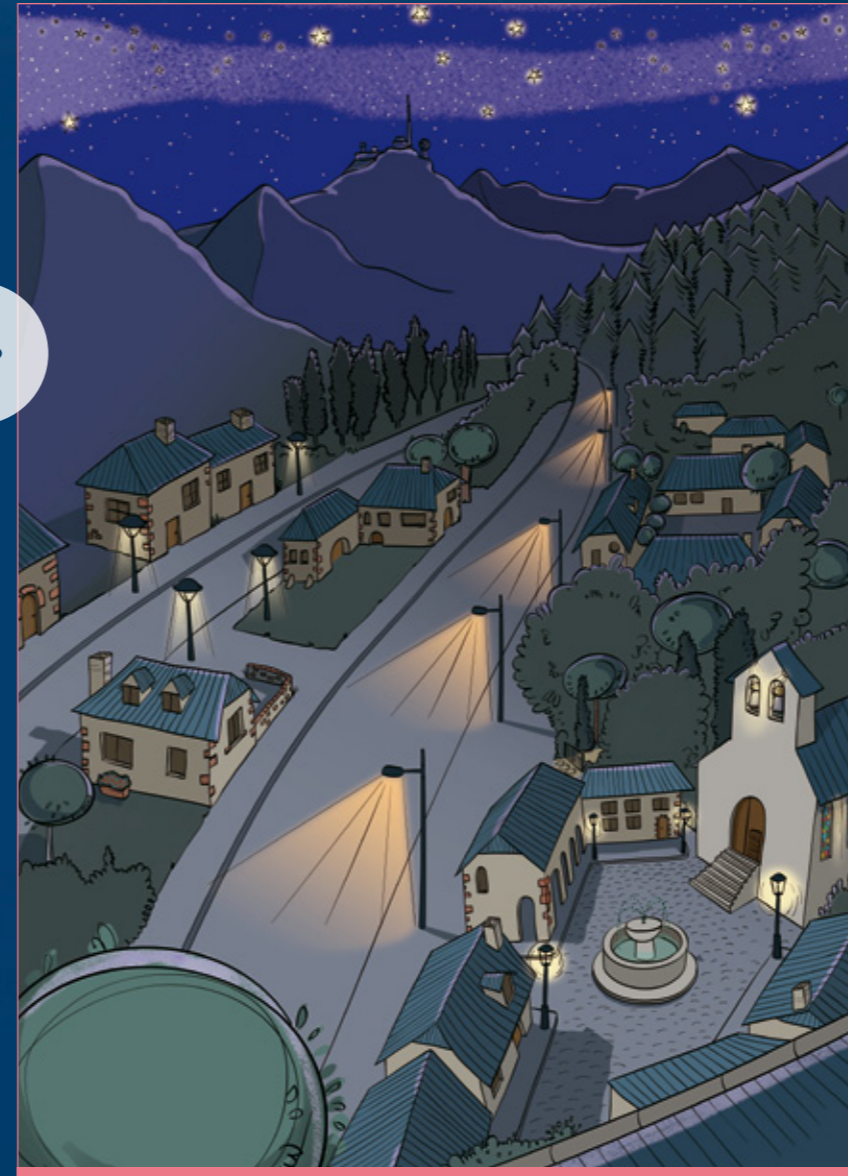
AVANT L'AMÉLIORISATION DE L'ÉCLAIRAGE PUBLIC