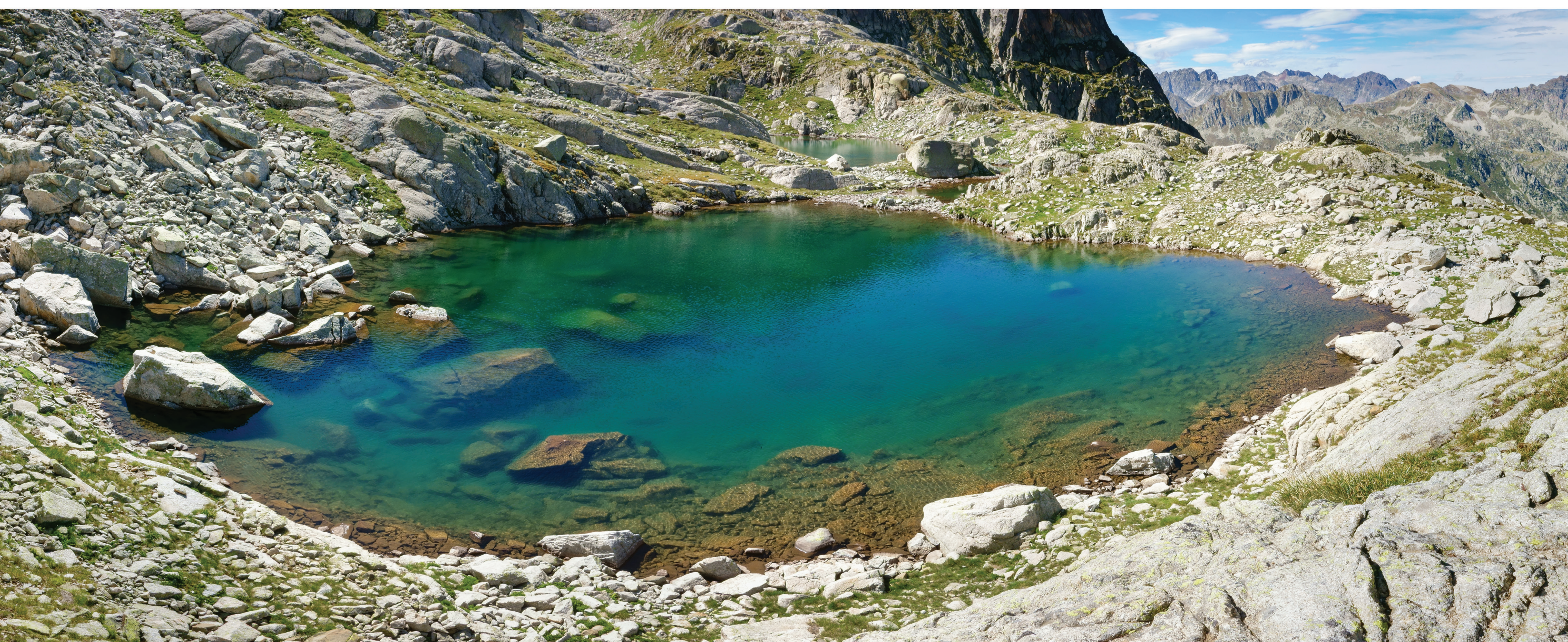
Foto superior: Lago de la Bova (Andorra) © F. Prud'homme - CBNPMP

En verano se forma en su superficie una capa de temperatura más elevada denominada epilimnion y en la profundidad se establece una capa más fría, el hipolimnion. En invierno, las capas se invierten. Durante la estación intermedia, se produce una mezcla cuando la temperatura del agua es homogénea en el lago. Este fenómeno permite la oxigenación de las aguas profundas. Es esencial para mantener la vida acuática en toda la columna de agua.