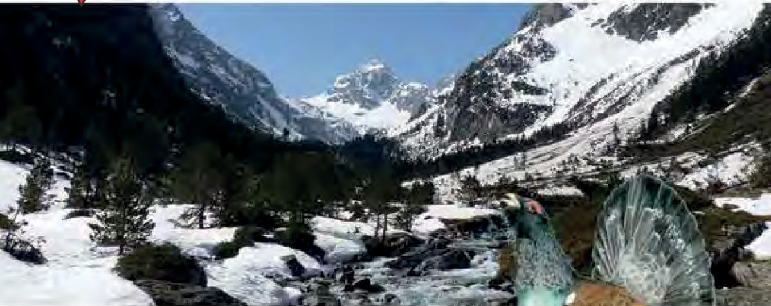
La vallée du Lutour à la sortie de l'hiver.