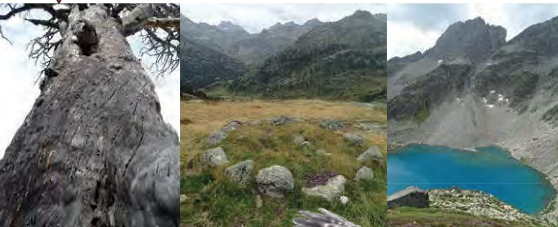
Pin mort perforé par les pics et les insectes (gauche). Cromlech (centre). Vue sur le lac d'Opale (droite).