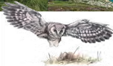
Chouette de Tengmalm en chasse

À quelques mètres du chemin, sur votre gauche, vous observez de petits ronds de pierres. Il s'agit de cromlechs,