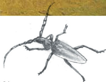
Le Grand Capricorne dont la larve se nourrit de bois mort (essentiellement de chêne). On parle d'espèces saproxylophages.

Les vieux chênes qui abritent le Lucane cerf-volant et le Grand Capricorne sont flanqués d'un macaron vert. Pour repérer la présence de ces insectes, regardez si l'écorce au bas du tronc est percée de trous de 3 à 4 centimètres