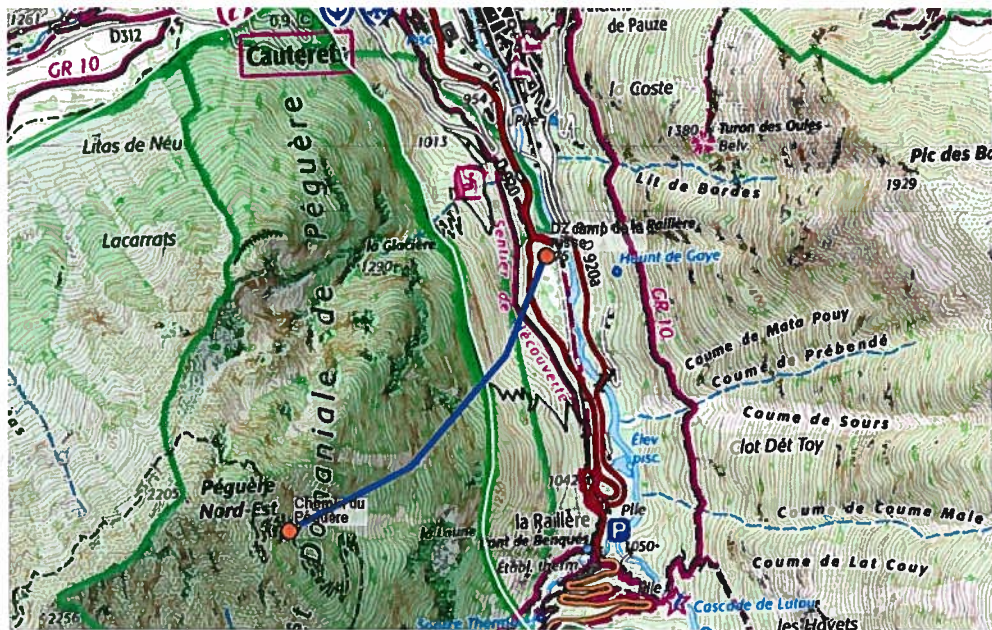
Figure 1 : Plan de vol proposé