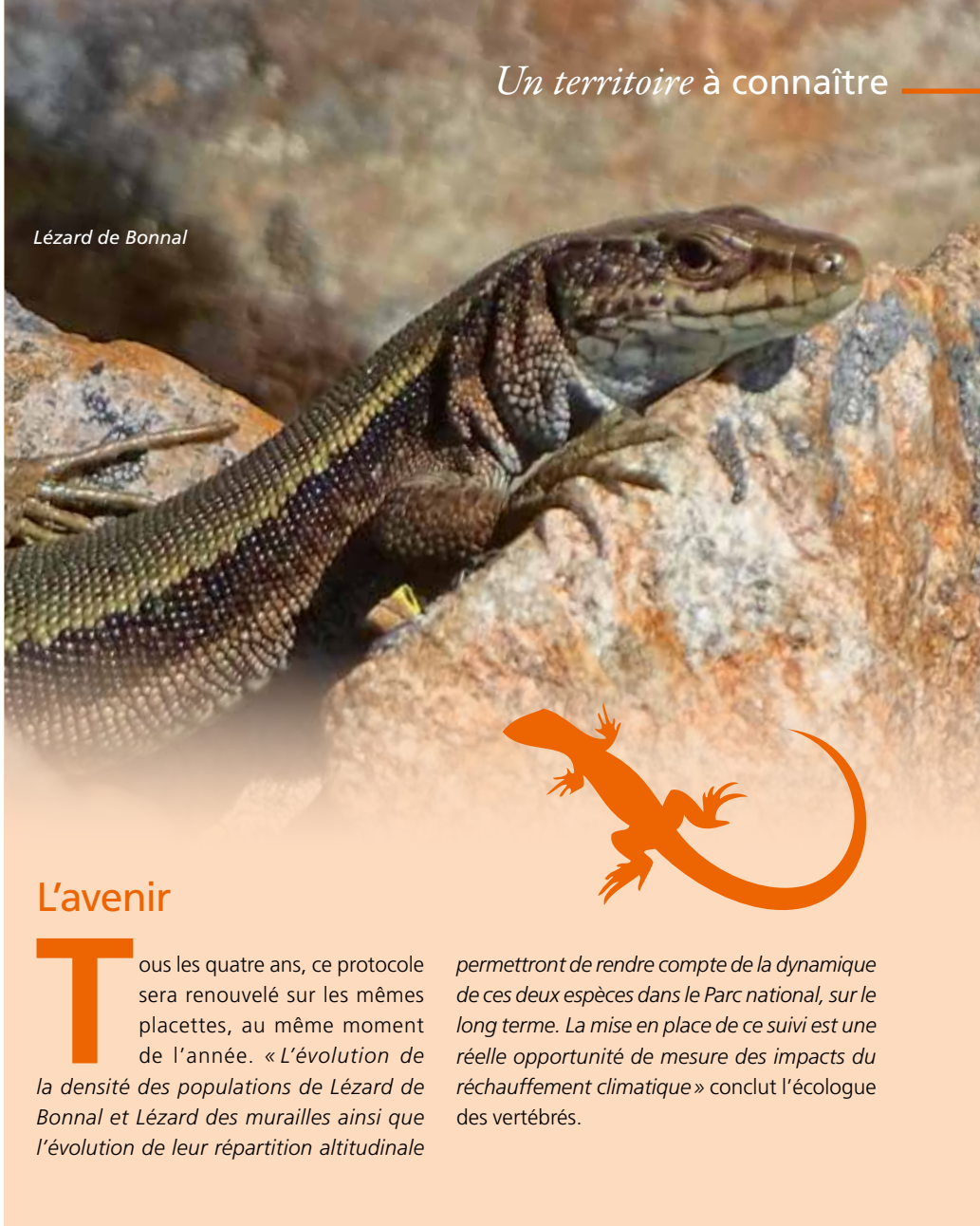
Lézard de Bonnal