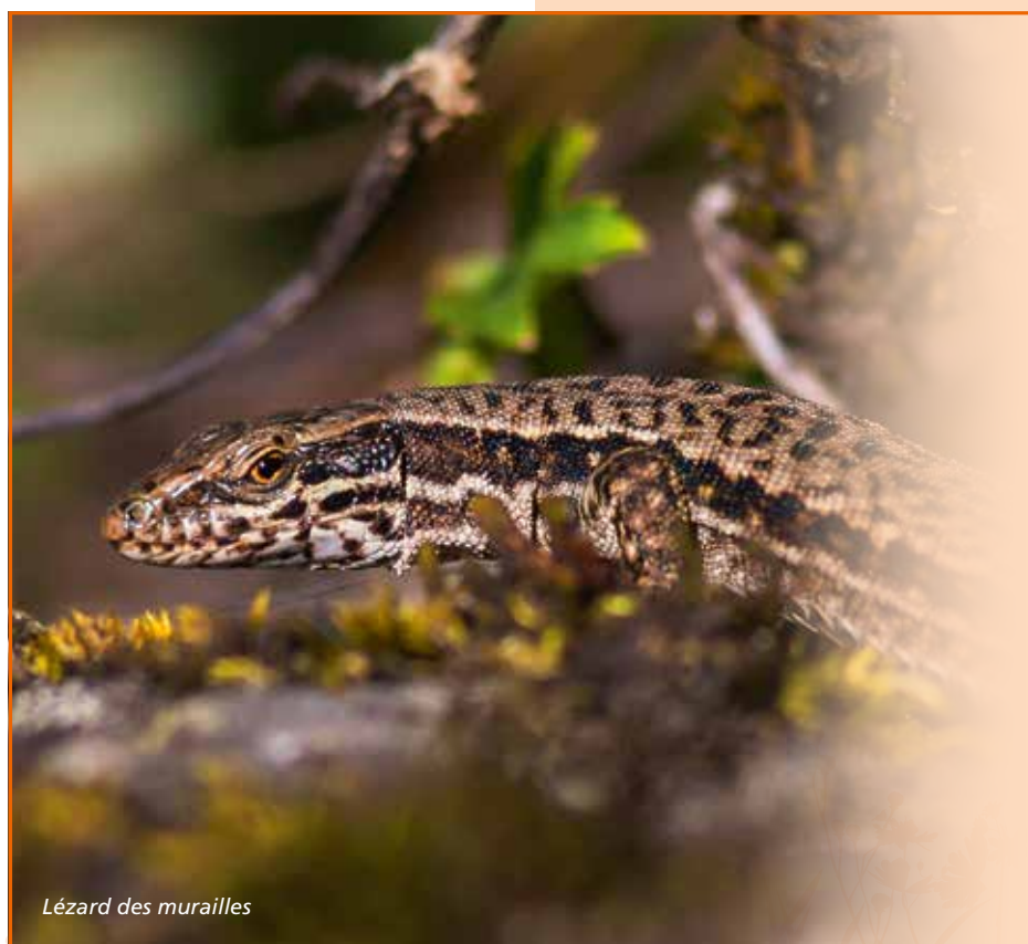
Lézard des murailles

permettront de rendre compte de la dynamique de ces deux espèces dans le Parc national, sur le long terme. La mise en place de ce suivi est une réelle opportunité de mesure des impacts du réchauffement climatique » conclut l'écologue des vertébrés.