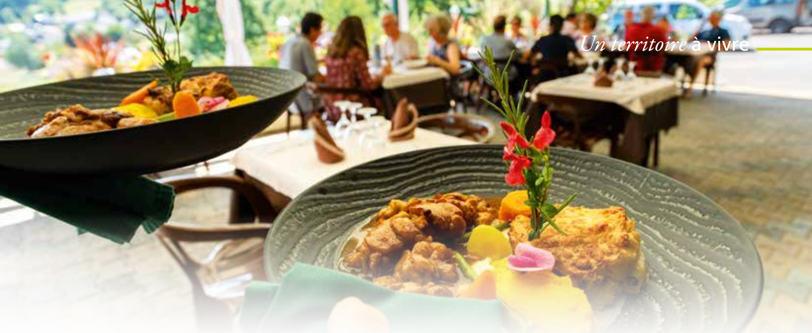
La nature inspire nos cuisines et ouvre l'appétit