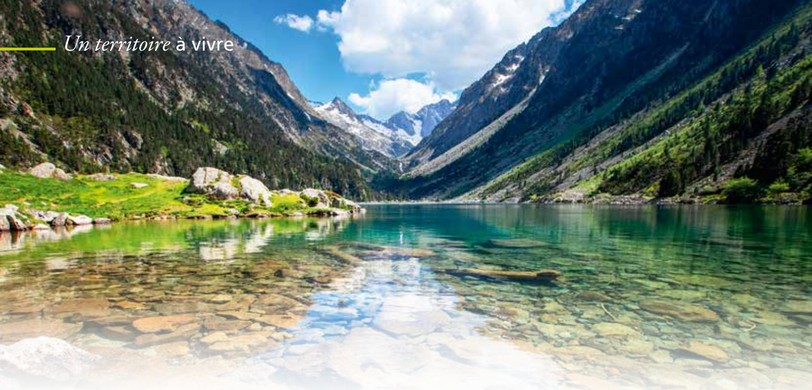
Emblématique lac de Gaube