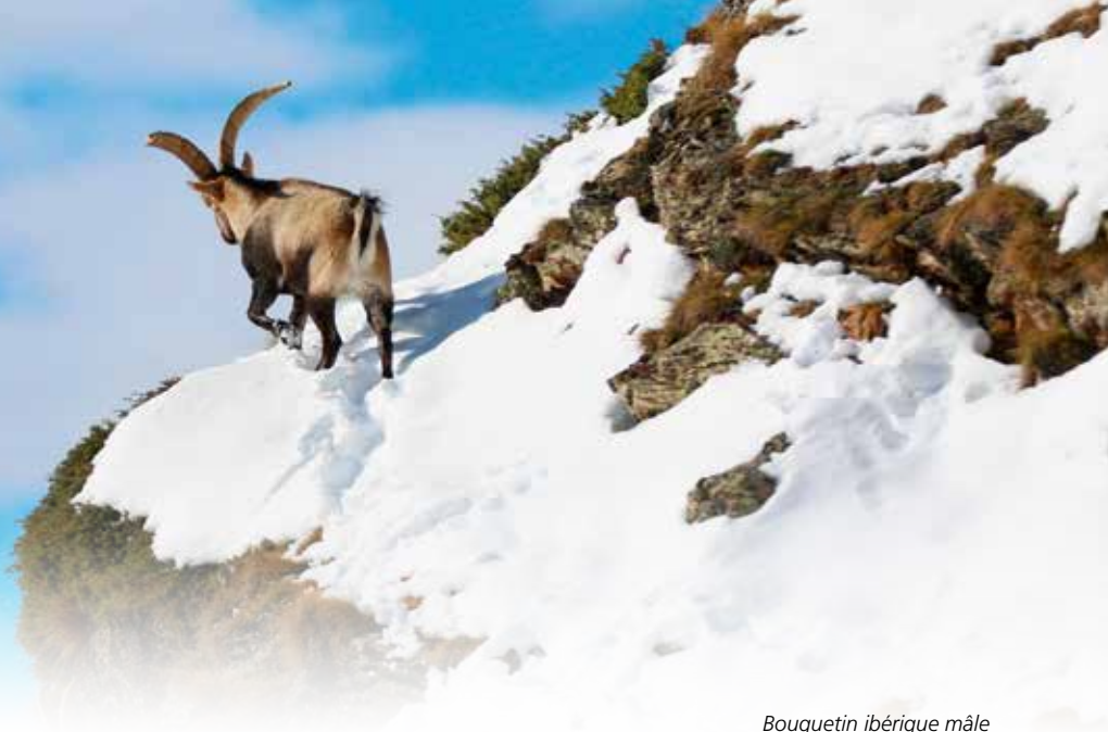
Bouquetin ibérique mâle