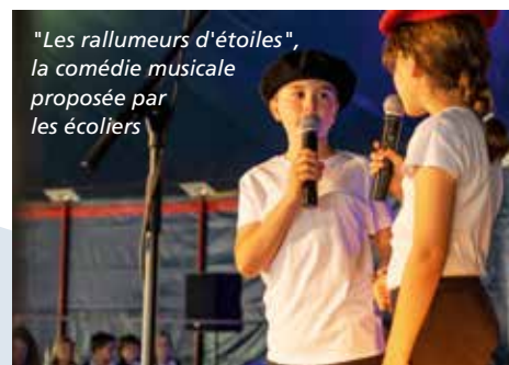
"Les rallumeurs d'étoiles", la comédie musicale proposée par les écoliers