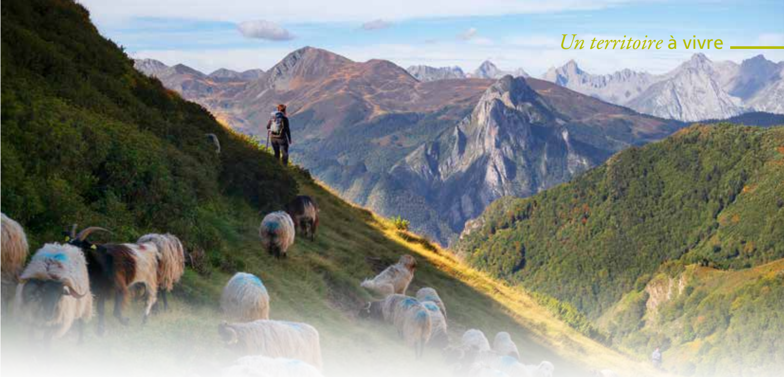
Sur les hauteurs d'Etsaut, Elise Thébaut et son troupeau