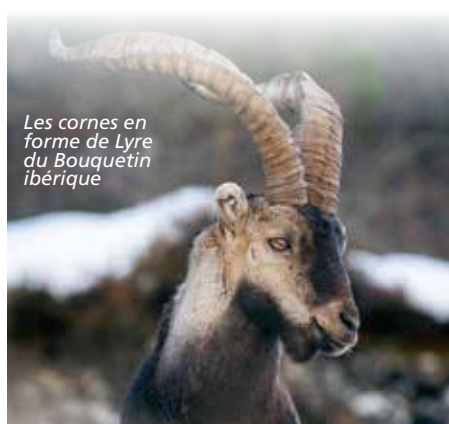
Les cornes en forme de Lyre du Bouquetin ibérique

A ce jour, ce projet de restauration d'une espèce sauvage s'est traduit par vingt opérations de lâchers entre 2014 – 2021. Cent-quarante-neuf ongulés venus de la Sierra de Guadarrama (Madrid) ont ainsi été amenés à fouler les espaces rocheux du Parc national des Pyrénées en trois secteurs distincts, créant trois noyaux de population, destinés à se rejoindre à terme : Cauterets, Gèdre-Gavarnie et Etsaut. Ce programme apparaît aujourd'hui comme une réussite. Et pourtant, le chemin ne manqua pas d'embûches, de rebondissements et de très fortes contraintes. Entre les craintes du monde de la chasse en Espagne, rassuré par le classement du Bouquetin ibérique en tant qu'espèce protégée en France, les fortes exigences sanitaires afin d'éviter toute arrivée de maladie, et le choix des sites de lâchers, il fallut aux équipes du Parc national, une grande persévérance et une réelle expertise scientifique et de terrain pour atteindre les objectifs d'un tel programme.