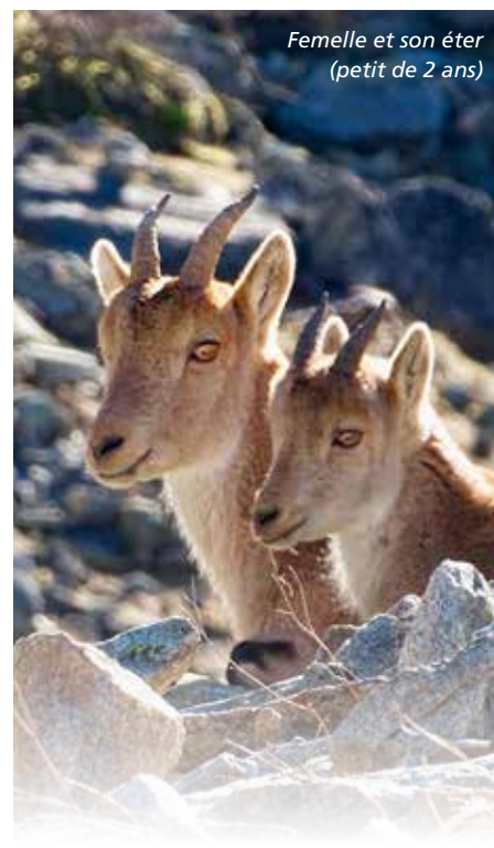
Femelle et son éther (petit de 2 ans)

R apidement, l'observation des animaux relâchés, facilitée par la pose de colliers émetteurs, a permis de constater le retour de leurs comportements naturels (déplacements, structure sociale et cycle biologique). Ces éléments attestent de l'appropriation par le Bouquetin de ses nouveaux espaces de vie. Près de 270 cabris sont nés entre 2014 et 2022 dans le Parc national avec un taux de survie important. En 2023, plus de cinquante naissances ont déjà été constatées alors que la période des mises bas n'est pas terminée. La dynamique de reproduction progresse sur une tendance très positive. Le suivi sanitaire réalisé par recapture d'individus et analyses sérologiques montre par ailleurs l'excellente santé des animaux et leur très bonne croissance. En constante augmentation, la population est composée d'environ trois cent quarante individus (2022). Huit années seulement après la première opération de réintroduction, cet effectif est conséquent. Il devrait continuer à progresser rapidement du fait du nombre