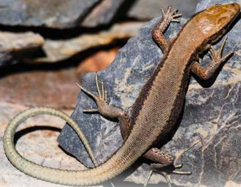
Lézard de Bonnal avec ses bandes latérales noires uniformes et son aspect métallique caractéristique