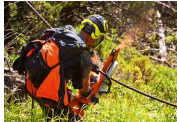
Section des câbles électriques

En val d'Azun, les gardes-moniteurs du Parc national ont démonté et évacué, à dos d'agents, une vieille clôture à l'abandon aux abords d'une place de chant fréquentée par le Grand Tétrás.