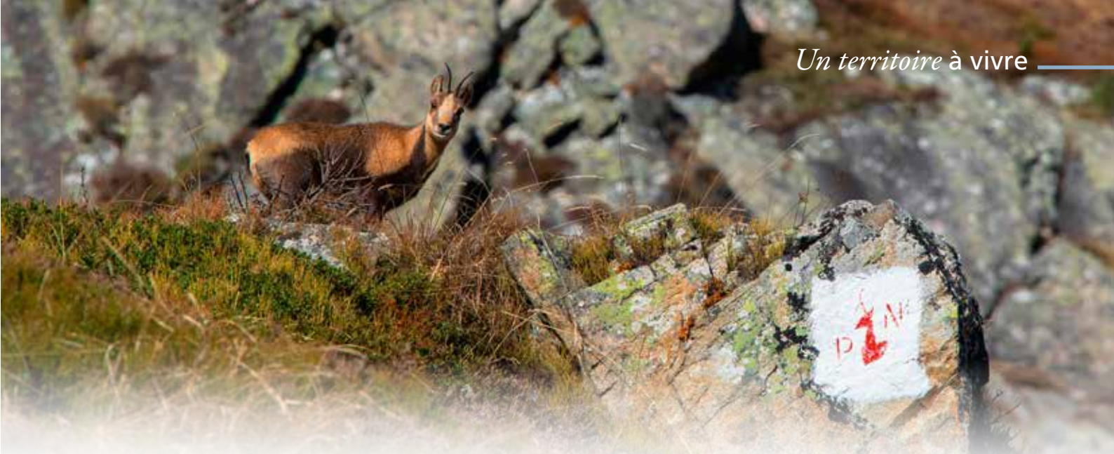
Une tête d'isard rouge sur fond blanc matérialise la limite de la zone cœur du Parc national, la direction des cornes en indiquant l'entrée.